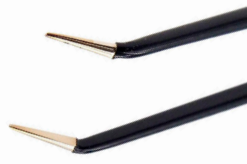
チップ幅 0.6mm 上向