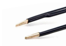
チップ幅 1.5mm イリゲーション