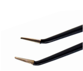
チップ幅 1.0mm 上向