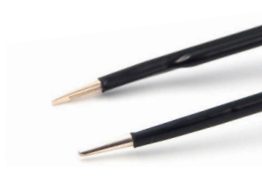
チップ幅 1.0mm イリゲーション