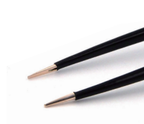
チップ幅 1.0mm イリゲーション