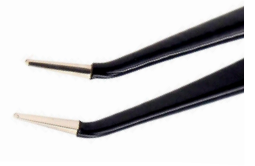
チップ幅 1.0mm 上向