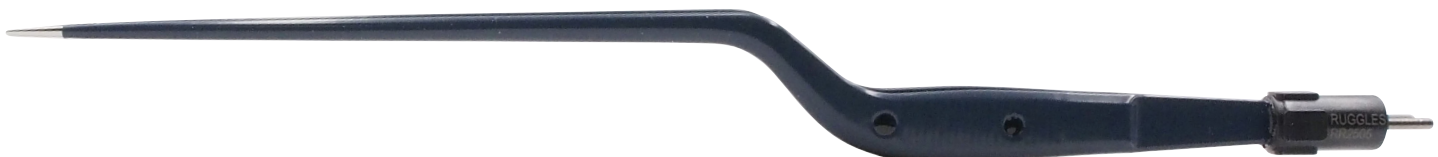
RR2505 先端チップ素材:ステンレス鋼