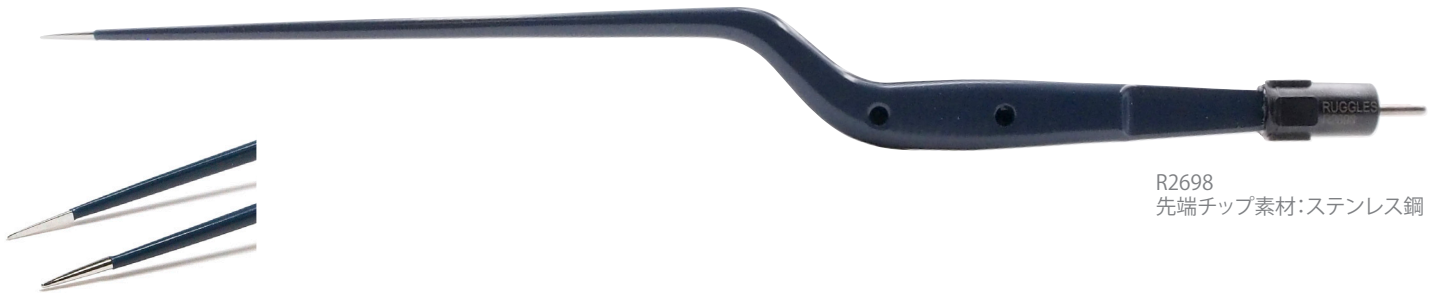
R2698 先端チップ素材:ステンレス鋼