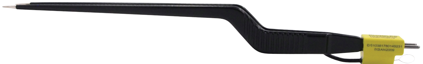
NI22BS06 先端チップ素材: 銀合金