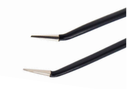
チップ幅 0.5mm 上向