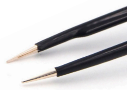
チップ幅 0.7mm イリゲーション