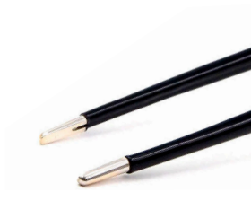
チップ幅 2.0mm イリゲーション