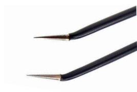
チップ幅 0.2mm 上向