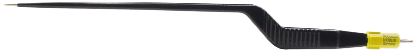
N13BL06 先端チップ素材: 銀合金