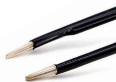
チップ幅 1.5mm イリゲーション