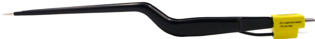
N19C07 先端チップ素材:銀合金