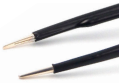
チップ幅 1.0mm イリゲーション