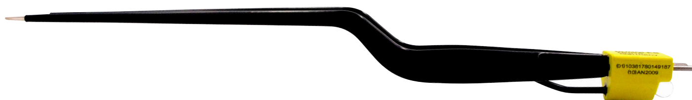
NHI10 先端チップ素材:銀合金