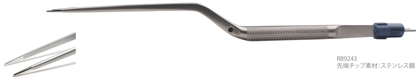
RB9243 先端チップ素材:ステンレス鋼