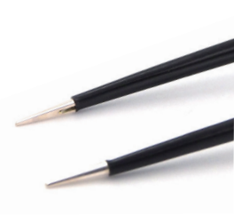
チップ幅 0.6mm イリゲーション